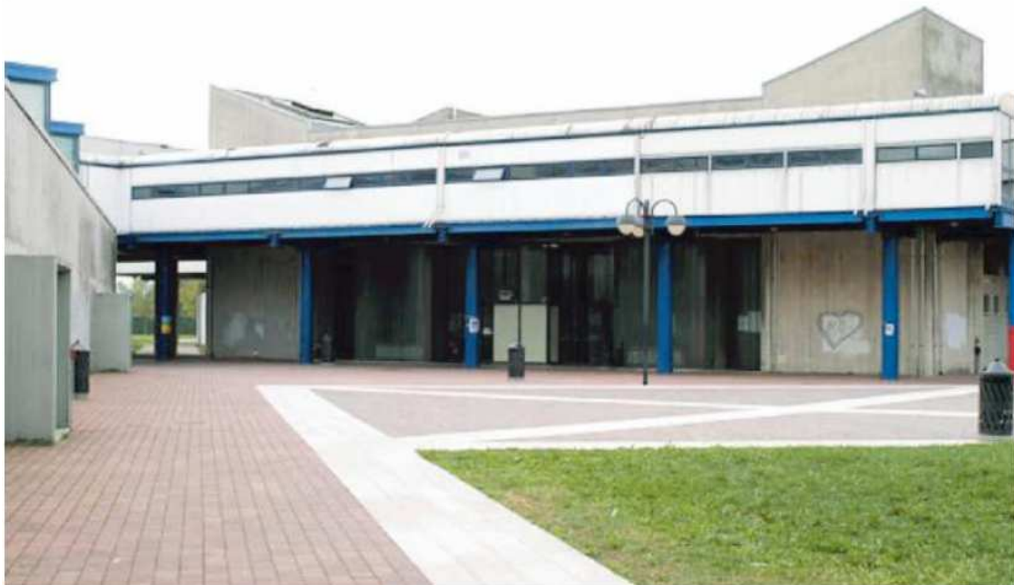
L'Istituto tecnico Levi Ponti di Mirano, dove si è svolto l'esame di maturità contestato