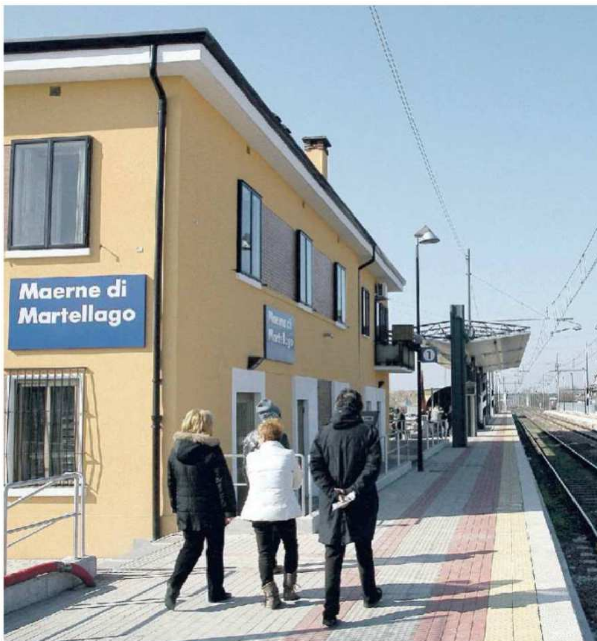
MARTELLAGO Appello a sostegno dei finanziamenti per la linea da Maerne a Castelfranco