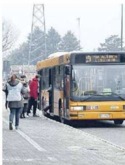
AVM Tornano i buoni mobilità

l'utente dovrà presentare la propria istanza tramite il portale sviluppato ad hoc dalla Città Metropolitana di Venezia da venerdì 1 settembre a venerdì 20 ottobre. La pubblicazione delle graduatorie è prevista entro il 31 ottobre 2023, quindi per la liquidazione dell'incentivo sarà necessario attendere 60 giorni e avverrà tramite bonifico bancario, sul conto corrente comunicato dal beneficiario. «La Città metropolitana, su input del sindaco Luigi Brugnaro, prosegue il suo lavoro di sostegno alla mobilità sostenibile degli studenti e del personale - dichiara Paolino