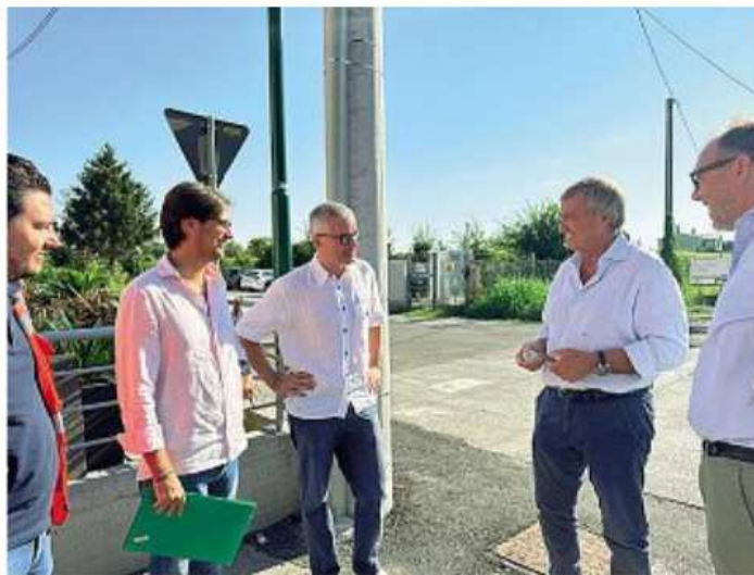
In sopralluogo il sindaco Luigi Brugnaro con i tecnici ieri mattina. A destra, la pista ciclabile

«Obiettivo principale di questa amministrazione è stato progettare e avviare la realizzazione di percorsi utili a raccordare le diverse parti del territorio – sottolinea il sindaco – con questo intervento la nostra rete ciclabile comunale supera i 180 chilometri. Grazie agli altri progetti e ai cantieri attualmente in corso entro il 2025 superere-